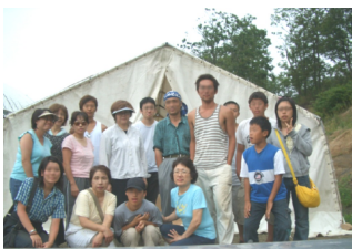
豚舎建設を手伝う中高大生 夏のキャンプ

また、友の会の公共費は「われらの公共費」「友の家醸金」「共働学舎」の3つに分かれていて、共働学舎への公共費はその自立のために使われます。子ども達の教育のための基金もあります。お肉を購入することも、公共費に差し出すことも私達に出来る協力です。どうぞ皆さんの気持ちをお寄せ下さい。