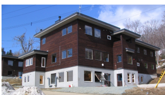
現在の寧楽共働学舎