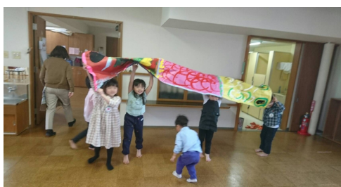
こいのぼりは子どもたちのおうちを順番に訪問中です